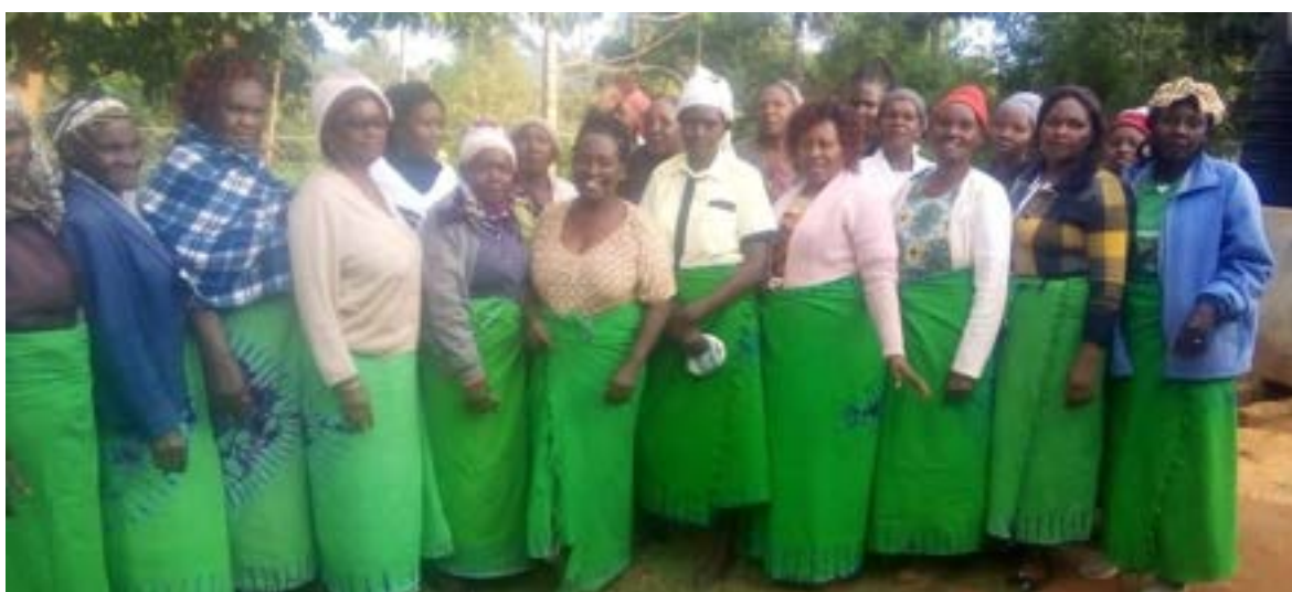
Grup Kanini Kaseo

Cada any les reunions amb els grups de dones de Kithunthi son un regal ,son moments per compartir i també elles fan demandes com a grup per aconseguir finançament pels seus projectes, actualment estan millorant com fer les sol·licituds d'ajuda, omplint un breu qüestionari i facilitant pressupostos reals i assumibles, així com demostrar que els projectes que volen desenvolupar son viables i sostenibles, es un procés d'aprenentatge important i necessari per ajudar-les a ser més protagonistes dels canvis que volen aconseguir pels seus grups, famílies i comunitat