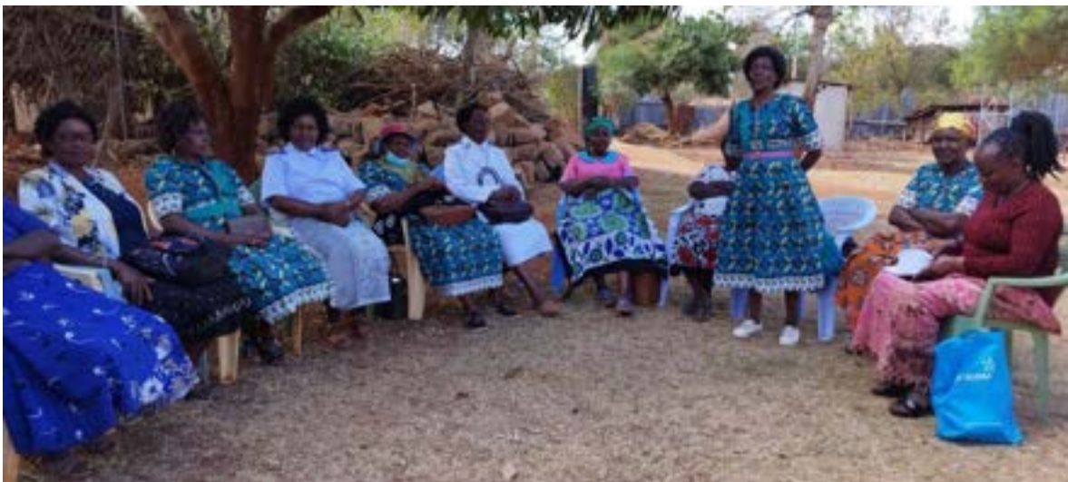
Grup de vídues