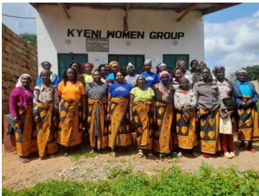
Una part del grup Kyeni davant el nou local

Conjuntament vam treballar per millorar i ampliar aquest projecte, es va comprar una parcel·la de terra i la construcció d'un nou local que ara es propietat del grup Kyeni, amb la compra de dues màquines més es poden moldre diferents tipus de blat i així s'arriba a més gent. La gestió econòmica la porten molt bé, i és un projecte que beneficia a tota la comunitat de Kithunthi.